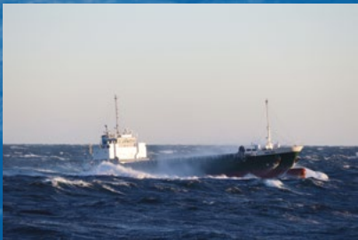
応募総数 253 点の中から厳選 12 作品を展示

内 航船とは国内の港と港をつないで物資を運ぶ船のことです。日本では外航船で海外から大量に物資を運んで来ていますが、その物資を国内各地の津々浦々、大小の港に運んでいるのが内航船です。得意分野は、産業が利用する多種多様の物資(原材料)を専用船を用いて一度に大量に輸送すること。なんと！この産業基礎物資の輸送でみると、国内全体の8~9割を内航船が担っているのです！！朝一番、24時間体制で夜の航海をくぐり抜けてきた内航船が港に到着すると、工場が、町が、市民生活が、音を立てて動き出します。離島をつないでいる船、生活航路を走る船も内航船の一つです。台風などで船が入港できないと、島のコンビニから商品が無くなってしまおう程の影響があります。船員はなんとか接岸しようと試みます。近年頻発している豪雨災害などで道路や鉄道が寸断された時は、実は内航船が大活躍しています。島国日本は離島でなくても、物資が届かない同様のリスクがあります。市民が不安を感じる事なく、いつもの市民生活を過ごせるよう内航船員は今も日本の周りを走っています。