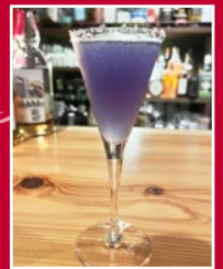
函館トワイライト

今年も東京スカイツリー下のカフェバー「LOBO」で、写真展を開催します。オリジナルのカクテルも考案。商船船員の「海」を鑑賞しながら、是非一杯！