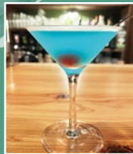
ブルーライト ヨコハマ