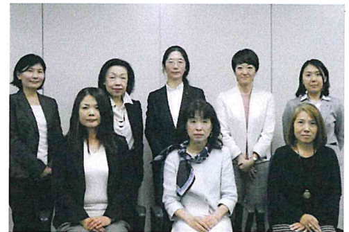
＜検討会委員の皆様＞

※フネージョ・・・船員や造船・船用工業など海事分野で働く女性を幅広く象徴する造語。イタリア語の「アダージョ」（「くつろぐ」、「ゆっくりと」等の意）の語感を込め、母なる大洋を船舶が優雅にゆっくりと航行する姿を想像させ、職場を寛がせるイメージ。