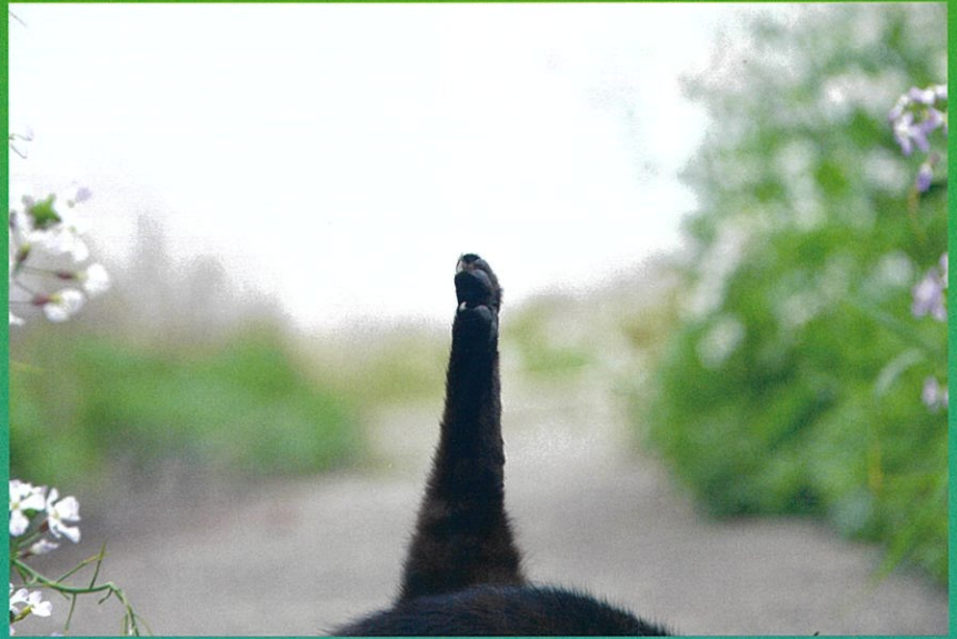
写真：第34回マリナーズ・アイ展 推薦「花咲く頃」加藤和弘